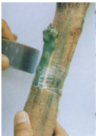
ใช้ยอดพันธุ์ดีเสียบกิ่งกับต้นพันธุ์โชคอนันต์