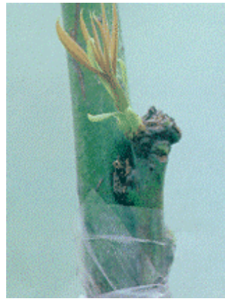
ยอดพันธุ์ดีเริ่มแตกตา เปิดพลาสติก ให้ยอดพันธุ์ดี เจริญเติบโต (ภาพ ค)