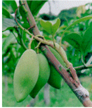
ควรเสียบกิ่งที่ปลายยอด ทำให้แทงช่อได้ดี