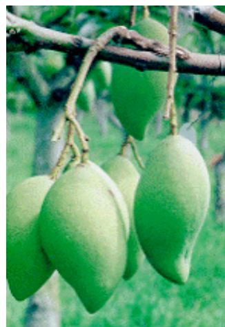
ให้ผลพันธุ์ดีตามที่ต้องการนอกฤดู