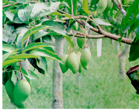
ให้ยอดพันธุ์ดีเจริญเติบโตต่อไป