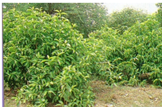
📎 ลักษณะทางพฤกษศาสตร์

จำปีเป็นไม้ยืนต้นพุ่มใหญ่ ใบยาว ประมาณ 18-22 เซนติเมตร สีเขียวเข้ม รูปร่างมนรี ปลายใบแหลม ขอบใบเรียบ ดอกมีสีขาวครีม มีกลิ่นหอมออกดอกบริเวณส่วนยอดของกิ่งและตามซอกใบ ดอกจะเริ่มบานประมาณ 20.00 น. (หรือ 2 พุ่ม) เป็นต้น