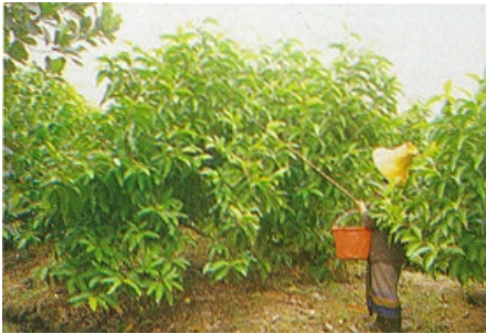
✍ การเก็บดอกจำปี

ผลิตมาก จะต้องเก็บ 2 รอบคือ ตอนหัวค่ำและตอนเช้ามีด การเก็บในเวลาที่มีแสงสว่างจะทำให้ดอกบานและเฉาเร็วเก็บไว้ได้ไม่นาน จึงไม่นิยมปฏิบัติกัน