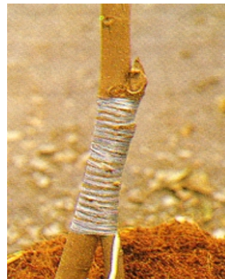
📌 ลักษณะการพันที่รอยทาบเว้นช่องว่างไว้