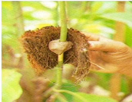
📌 หุ้มทับกิ่งตอนด้วยถุงขุยมะพร้าว

จำปีนิยมขยายพันธุ์โดยการตอนกิ่ง กิ่งตอนจำปีจะออกรากดีที่สุดในฤดูฝน กิ่งที่ใช้ตอน กิ่งที่ใช้ตอนควรเป็นกิ่งไม้แก่ หรืออ่อนเกินไป คือกิ่งสีเขียวอมน้ำตาล ซึ่งจะลอกเปลือกได้ง่าย วิธีการตอนทำเช่นเดียวกับตอนทั่วๆ ไป แต่หลังจากควั่นกิ่งแล้ว ควรทิ้งไว้ 3-4 วัน จึงใช้ดินหุ้มรอยควั่น แล้วหุ้มทับด้วยกาบมะพร้าวที่แช่น้ำจนชุ่มแล้วทุบจนนิ่ม หรือจะใช้ขุยมะพร้าวก็ได้ จากนั้นใช้ใบตองแห้งหรือพลาสติกหุ้มอีกชั้นหนึ่ง ถ้าสังเกตเห็นว่าดินแห้ง ควรรดน้ำให้เป็นครั้งคราว เพราะถ้าดินที่หุ้มรอยควั่นแห้งจะทำให้กิ่งตอนไม่ออกราก หลังจากตอนประมาณ 2 เดือน จะเห็นรากแทงผ่านใบตองออกมา จึงเอาใบตองหรือพลาสติกมาหุ้มทับหลังจากนี้ประมาณ 10-15 วัน หรือเมื่อรากเดินเต็มถุงก็ตัดปลูกลงได้ ถ้ายังไม่ตัดกิ่งตอนสามารถ ปล่อยกิ่งตอนไว้บนต้นไม้ขนาดใหญ่ประมาณหนึ่งปี โดยต้องคอยน้ำอย่าปล่อยให้วัสดุที่ตอนแห้ง กิ่งตอนจะตายได้