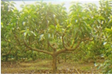
ลักษณะการตัดแต่งทรงต้นเพื่อเก็บดอก

ดอกชายตลาดท้องถิ่นสามารถควบคุมให้จำปีทยอยออกดอกเพื่อ ให้มีผลผลิตชายตลาดปี โดยทยอยตัดแต่งกิ่งแทนการตัดแต่งกิ่งทั้งแปลงพร้อมกัน