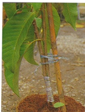
📌 เหลี่ยยอดต้นตอไว้