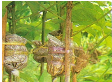
📌 หุ้มรอยควั่นด้วยดินหรือเปลือก

นอกจากจะขยายพันธุ์ด้วยการตอนแล้ว ยังสามารถขยายพันธุ์จำปีด้วยการทาบกิ่ง โดยใช้จำปาเป็นต้นตอต้นตอที่ใช้ควรมีขนาดใกล้เคียงกันกับกิ่งที่จะทาบต่างจากการทาบกิ่งไม้ผลทั่วไป คือ