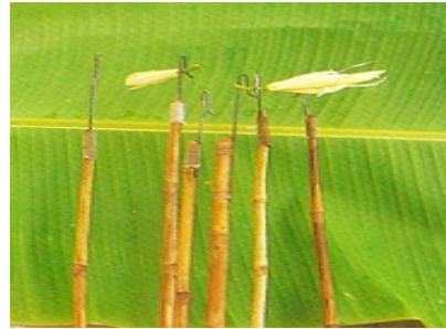
✍ เครื่องมือในการเก็บดอกจำปี