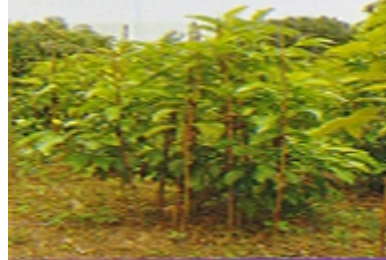
ลักษณะการตัดแต่งทรงต้นเพื่อการขยายพันธุ์

5. โรค แมลง และการป้องกันกำจัด จำปีเป็นพืชที่ไม่ค่อยมีแมลงศัตรูรบกวน จึงใช้สารเคมีค่อนข้างน้อยเมื่อเทียบกับพืชอื่น อย่างไรก็ตามศัตรูที่อาจพบได้ในการปลูกจำปี ได้แก่