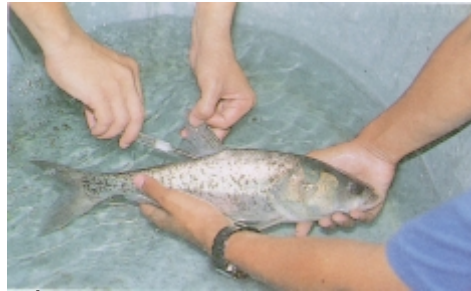
ภาพที่ 6 การฉีดฮอร์โมนในการเพาะพันธุ์ปลาจีน

ระหว่างเข็มที่ 1 กับเข็มที่ 2 เว้นระยะ 6 ชั่วโมง หลังจากฉีดเข็มที่ 2 แล้วจะผสมเทียมได้ภายในเวลา 4-9 ชั่วโมง