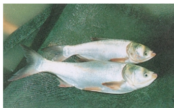
ภาพที่ 1 ปลาเกล็ดเงินหรือปลาลิ้น (Silver carp)

ปลาเกล็ดเงิน (ปลาลิ้น) (Silver carp) มีชื่อวิทยาศาสตร์ว่า Hypophthalmichthys molitrix (Cuv.&Val) ส่วนหัวมีขนาดปานกลาง ปากเขี้ยวเล็กน้อยอยู่ปลายสุดของส่วนหัว ขากรรไกรล่างเฉียงขึ้นมาเล็กน้อย ตาค่อนข้างเล็กและอยู่ใต้แนวระดับกึ่งกลางลำตัว ส่วนหนึ่งของเหงือกไม่เชื่อมสนิทกับแก้มส่วนล่าง มีอวัยวะ Super branchial อยู่ ซึ่งกรองเหงือกติดต่อกันเหมือนตะแกรง ที่ลักษณะคล้ายฟองน้ำ ฟันที่คอหอยมีข้างละแถว ๆ ละ 4 ซี่ พื้นหน้าตัดของฟันแบนเป็นร่องละเอียด ครีบหลังมีก้านครีบเดี่ยว 3 ก้าน และก้านครีบแขนง 7 ก้าน ครีบกันมีก้านครีบเดี่ยว 3 ก้านและก้านครีบแขนง 11-14 ก้าน ครีบอกมีก้านครีบเดี่ยว 1 ก้าน และก้านครีบแขนง 17 ก้าน ครีบท้องมีก้านครีบเดี่ยว 1 ก้าน และก้านครีบแขนง 8 ก้าน เกล็ดบนเส้นข้างลำตัวมี 110-123 เกล็ด ลำตัวรูปกระสวยแบนข้าง ส่วนท้องเป็นสันยาวจากอกถึงรูกัน ลำตัวส่วนหลังสีดำ เทา ส่วนอื่น ๆ สีเงิน