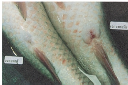
ภาพที่ 5 เปรียบเทียบลักษณะเพศของปลาเงา

ก่อนที่จะตัดพ่อแม่พันธุ์ต้องงดให้อาหาร 1 วัน เพื่อสามารถสังเกตท้องปลาได้แน่นอน ในกรณีที่เลี้ยงโดยการใส่ปุ๋ยคอกนำพ่อแม่ปลามาขังไว้ในบ่อพักก่อนการตัด ประมาณ 5-6 ชั่วโมง แม่ปลาที่มีไข่แก่จัดสังเกตได้จากส่วนท้องอูมเป่ง ผนังท้องบาง จับดูรู้สึกนิ่มหยุ่นมือ ช่องเพศและช่องทวารหนักบวมพองมีสีแดงเรื่อ ๆ สำหรับปลาเพศผู้ไม่ค่อยมีปัญหามากนัก อาจจะมีน้ำเชื้อดูเล็กน้อยหากมีน้ำเชื้อมีสีขาวขุ่นหยดลงน้ำแล้วกระจายดีก็ใช้ได้ แต่หากน้ำเชื้อค่อนข้างใสมีสีอมเหลืองหรืออมชมพูหยดลงน้ำและกระจายไม่สม่ำเสมอไม่ควรนำตัวผู้นั้นมาผสมเทียม