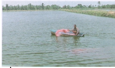
ภาพที่ 9 การหว่านอาหารรอบ ๆ บ่อเลี้ยง

จัดการเรื่องอาหารปลานั้น สามารถให้อาหารสมทบ หรืออาจเป็นอาหารสำเร็จรูปของปลากินพืช โดยให้อัตรา 1-2 % ของน้ำหนักตัวปลาที่ปล่อย สำหรับรูปแบบการเลี้ยงนั้น จะได้ยกตัวอย่างดังต่อไปนี้