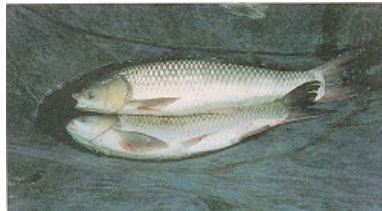
ภาพที่ 3 ปลากินหญ้าหรือปลาเฉา (Grass carp)

ปลากินหญ้า (ปลาเฉา) (Grass carp) มีชื่อวิทยาศาสตร์ว่า Ctenopharyngodon idellus (Cuv.& Val) ส่วนหัวค่อนข้างแบน ปากอยู่ปลายสุดเฉียงขึ้นเล็กน้อย ขากรรไกรล่างสั้นกว่าขากรรไกรบน ตาเล็ก สีเหลืองติดต่อกับแก้ม สีกรองเหลืองหางและสัน ฟันที่หอยมีอยู่ 7 แถว คล้ายหวี ข้างซ้ายมี 2-5 ซี่ ข้างขวามี 2-4 ซี่ ครีบหลังสั้น มีก้านครีบเดี่ยว 3 ก้าน และก้านครีบแขนง 7 ก้าน ครีบกันมีก้านครีบเดี่ยว 3 ก้าน และก้านครีบแขนง 8 ก้าน ครีบอกมีก้านครีบเดี่ยว 2 ก้าน ก้านครีบแขนง 14 ก้าน ครีบท้องมีก้านครีบเดี่ยว 1 ก้าน และก้านครีบแขนง 8 ก้าน เกล็ดขนาดใหญ่บริเวณข้างลำตัว 34-35 เกล็ด ลำตัวรูปกระสวยคล้ายทรงกระบอก หางแบนข้าง ส่วนหลังมีสีดำ น้ำตาล ท้องมีขาว