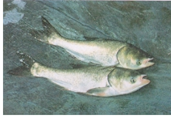
ภาพที่ 2 ปลาหัวโตหรือปลาชัง (Bighead carp)

ส่วนท้องเป็นสัน ตั้งแต่ครีบท้องถึงครีบกันหางแบนข้างและเป็นสัน ส่วนหลังจะมีสีดำและจุดดำบางแห่งท้องเหลือง