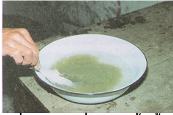
ภาพที่ 8 ล้างไข่ที่ผสมกับน้ำเชื้อแล้ว