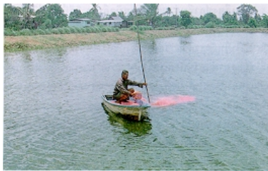
ภาพที่ 10 การให้อาหารเป็นจุด เพื่อทดสอบปริมาณอาหาร