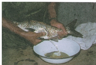
ภาพที่ 7 การรีดไข่เพื่อผสมเทียม

เมื่อได้เวลาประมาณ 4 ชั่วโมง หลังจากการฉีดแม่ปลาควรเริ่มสังเกตอาการของแม่ปลา เมื่อแม่ปลามีอาการกระวนกระวายผิดปกติ ว่ายน้ำไปมาอย่างรุนแรง ควรตรวจสอบแม่ปลาโดยใช้เปลผ้า ตักแม่ปลาขึ้นมาตรวจสอบ เมื่อพบว่าไข่ไหลพุ่งออกมาอย่างง่ายดาย ก็ให้นำมารีดและทำการผสมเทียมกับน้ำเชื้อปลาตัวผู้