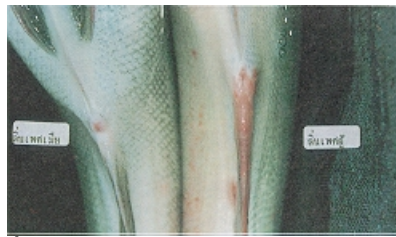
ภาพที่ 4 เปรียบเทียบลักษณะเพศของปลาชิ่ง